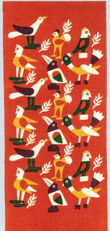
《小鳥》1992年 坂本善三美術館