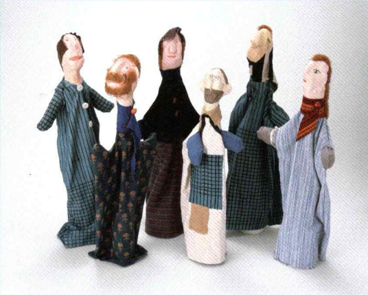
《町の人々》2004年 岩手県立美術館

日時：8月21日(木)～31日(日) ※月曜休館 ① 13:30～14:30 ② 15:00～16:00 会場：当館ワークショップ室 参加料：300円 ※先着順、受付でチケットご購入のうえ、ワークショップ室へ ※チケットは当日12:00より販売 対象・定員：小学生以上、各回10人