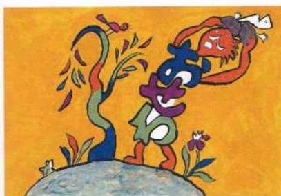
『ぜつぼうの濁点』原画 2006年 作家蔵