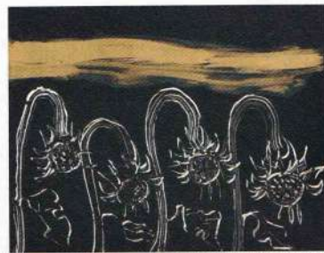
《去りゆくひまわり》2014年 公益財団法人泉美術館蔵