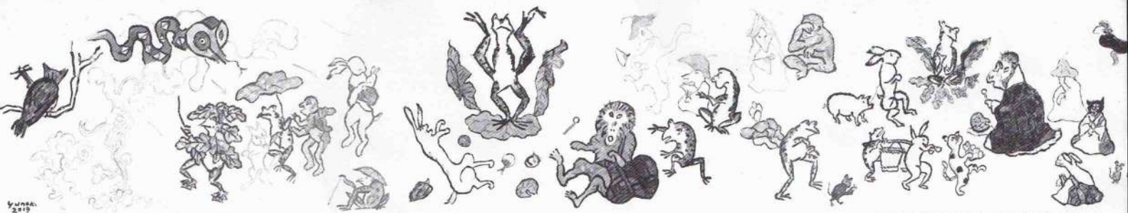
《鳥獣戯画》(部分) 2019年 作家蔵